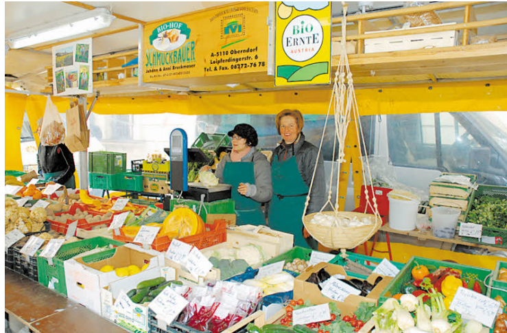
Die Bioschranne am Donnerstag erfreut sich großer Beliebtheit.

Die Bio-Konsumenten wünschen sich eine klare Abgrenzung und Erkennbarkeit der Bioanbieter auf den bekannten Frischemärkten der Stadt, sowie eine Ausweitung des Bioangebots. Nun hat der zuständige Vizebürgermeister grünes Licht gegeben, dass bis spätestens Mai 2011 die „Biomeile“ errichtet werden soll – auf beiden Märk-