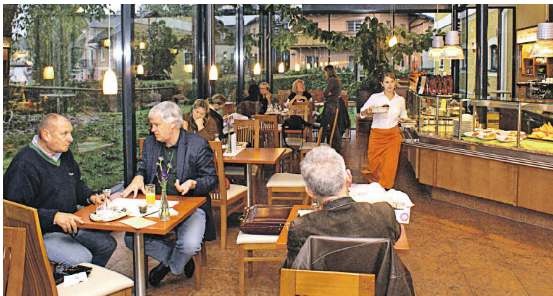
Der Rochushof mit seinem Wintergarten hat sich zu einem kulinarischen Treffpunkt entwickelt.

Nachdem die Eltern schon seit vielen Jahren biologisch wirtschaften und zu Salzburgs Bio-Pionieren gehören, liegt es auf