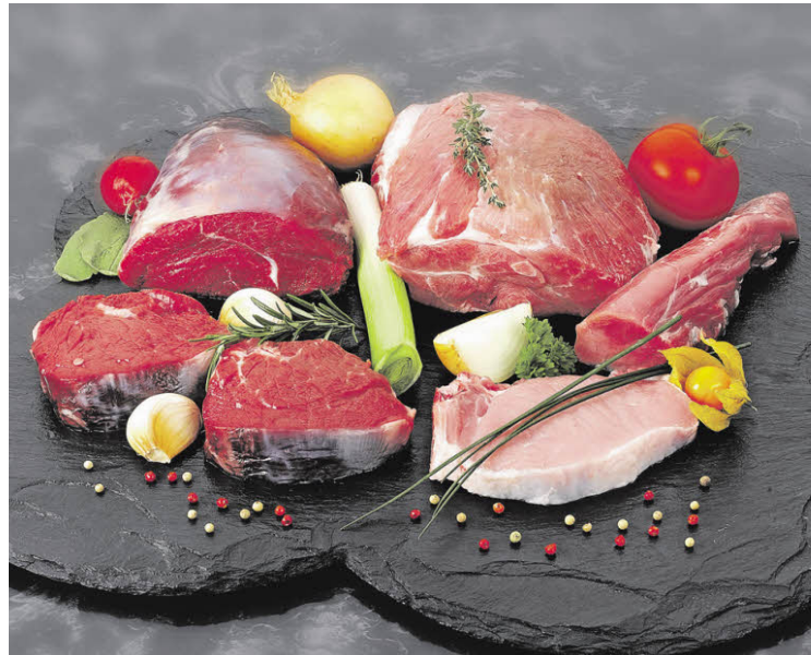
Fleisch aus Bioproduktion enthält besonders viele wertvolle Omega-3-Fettsäuren.