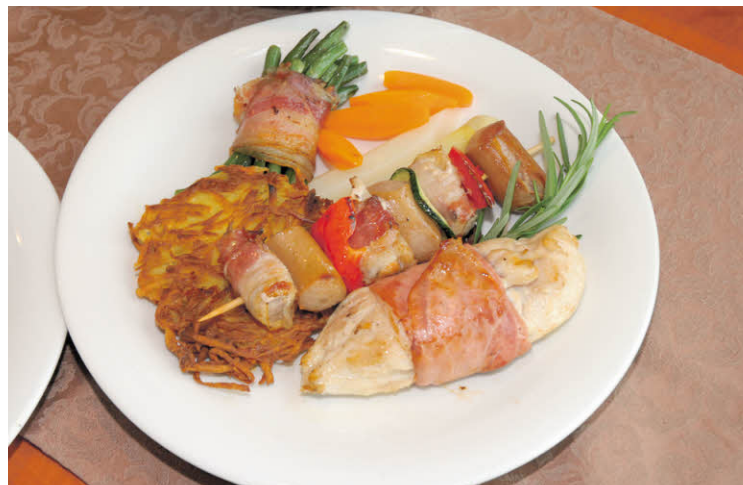
Guten Appetit: Biofleisch ist ein bekömmliches Essen.